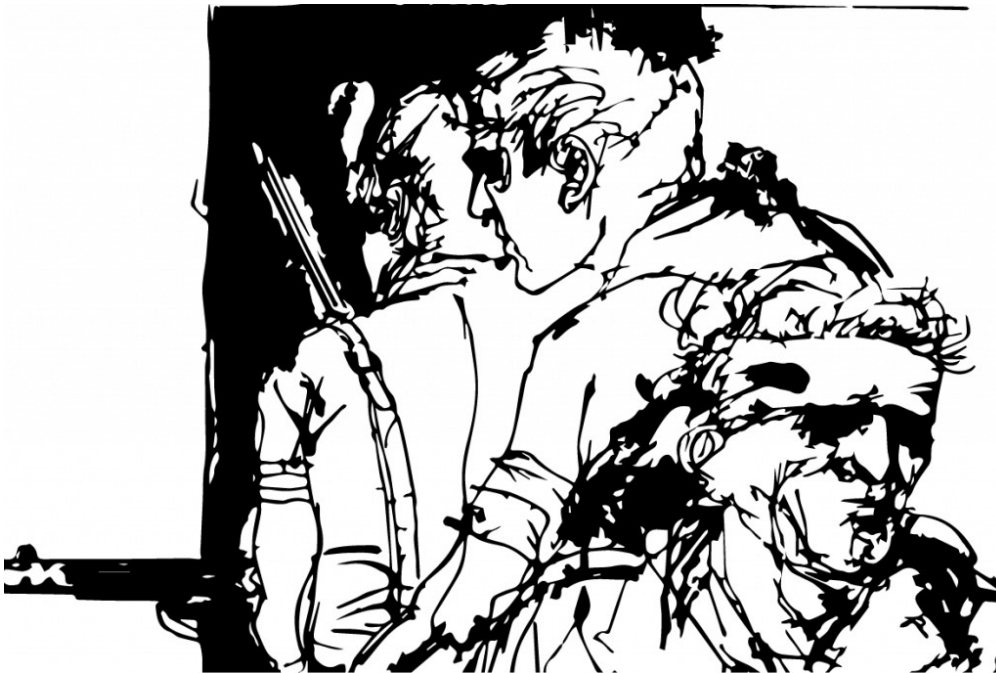
Logo sito Biografie Resistenti

La coincidenza dell’anniversario della Liberazione con l’Assemblea nazionale dell’Azione cattolica italiana, che inizia con l’incontro dell’associazione con papa Francesco, rappresenta anche un motivo per tornare a riflettere sul significato della Resistenza sotto un profilo storico, per quanto esso abbia anche inciso nella vita della comunità ecclesiale.